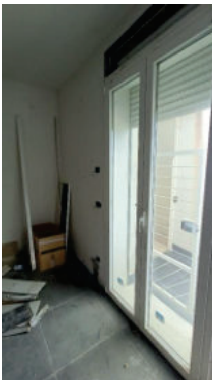
6- Finestra Salotto

Procedimento di esecuzione immobiliare n.58/2017 R.G.Es. – LOTTO 2 BANCA POPOLARE DI SPOLETO S.p.A., ora CERVED CREDIT MANAGEMENT S.P.A. (MANDATARIA DI 2WORLDS S.R.L.) contro GEDA COSTRUZIONI S.R.L.