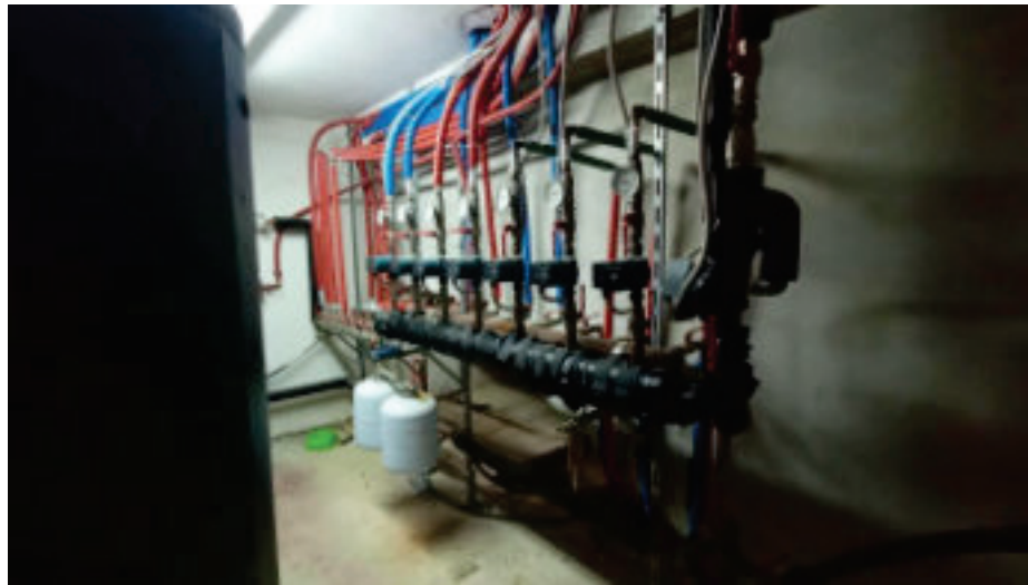
15. Locale Tecnico Accumuli e pompe