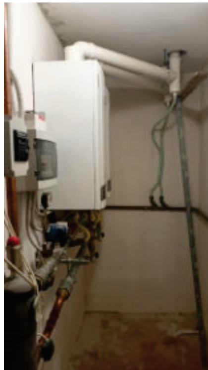
16. Centrale Termica