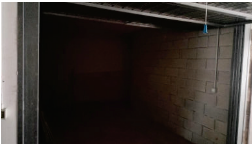
13. Interno Autorimessa