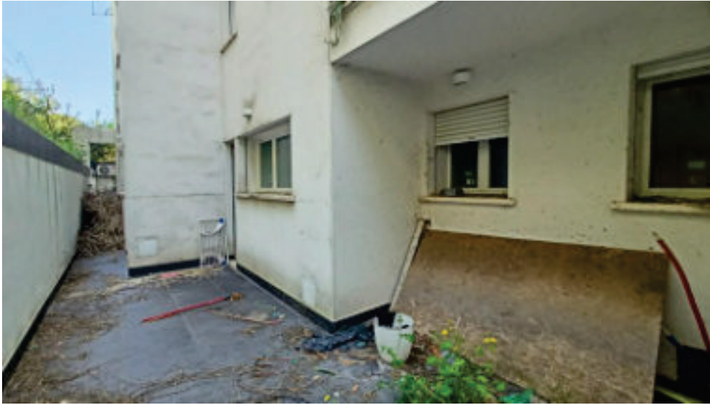
17. Pozzo Luce Retrostante