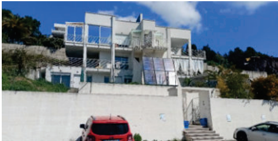
1 - Fronte principale edificio da Via dei Ligustri