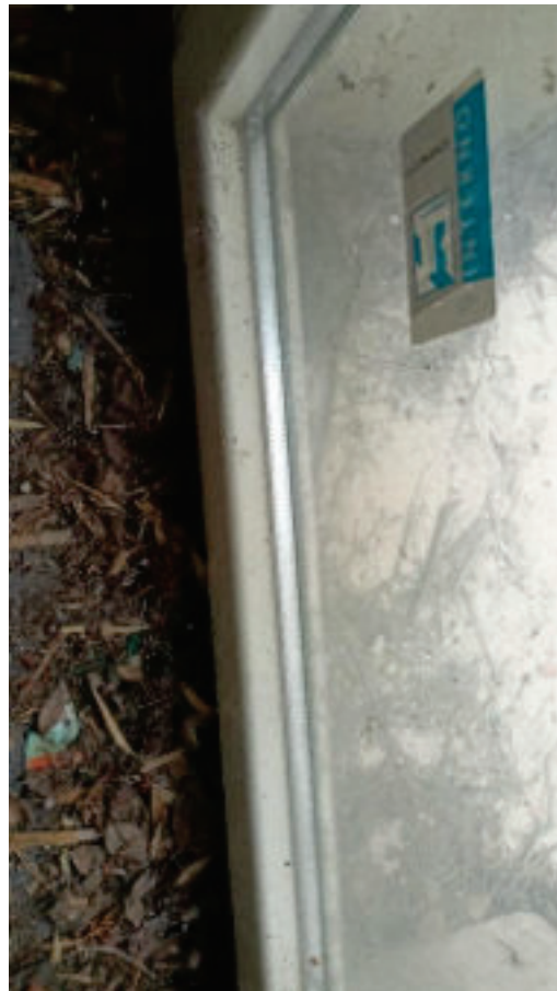
8. Infissi doppio Vetro