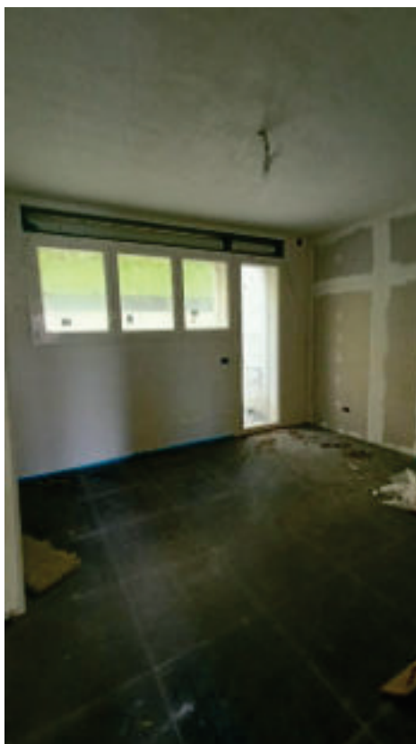
5- Camera da Letto