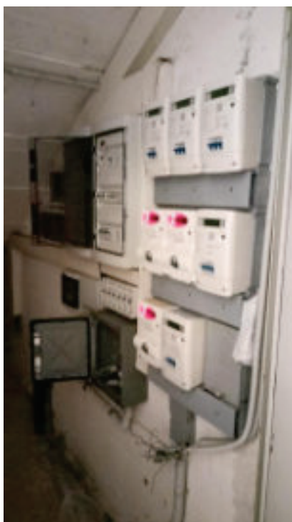
14. Quadro Contatori Energia Elettrica nel locale contatori