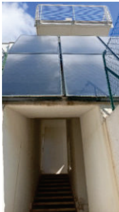
2- Vano scale Comune (Sub. 2-B.C.N.C.)