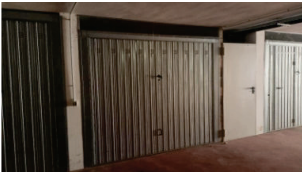
12. Autorimessa Sub. 6