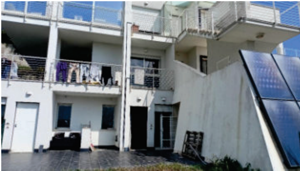
3- Corte ed ingresso Sub. 20